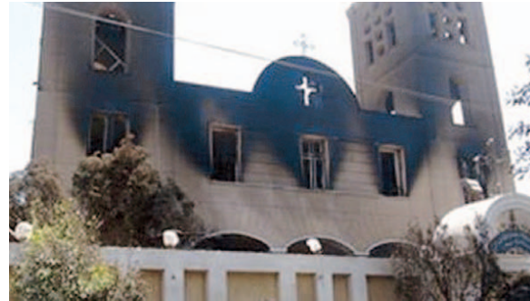
PRIMA E DOPO La chiesa dell'Annunciazione di Raqqa (a sinistra) nel 2008, durante un'allegria celebrazione. A fianco dopo essere stata data alle fiamme pochi giorni fa