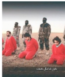
VERI TAGLIAGOLA Una scena drammatica diventata tristemente comune

«L'aggressione, aggravata dalla spaventosa messinscena dell'esecuzione - ha detto in vicesindaco - è qualcosa di estremamente preoccupante». Il luogo dell'agguato proprio di fronte alle sedi di due istituti bancari, potrebbe rivelarsi d'aiuto agli investigatori, che stanno già