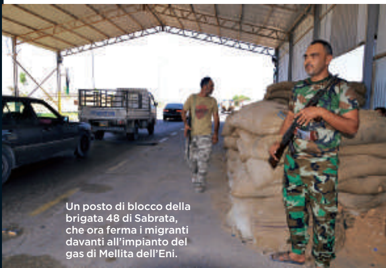
Un posto di blocco della brigata 48 di Sabrata, che ora ferma i migranti davanti all'impianto del gas di Mellita dell'Eni.