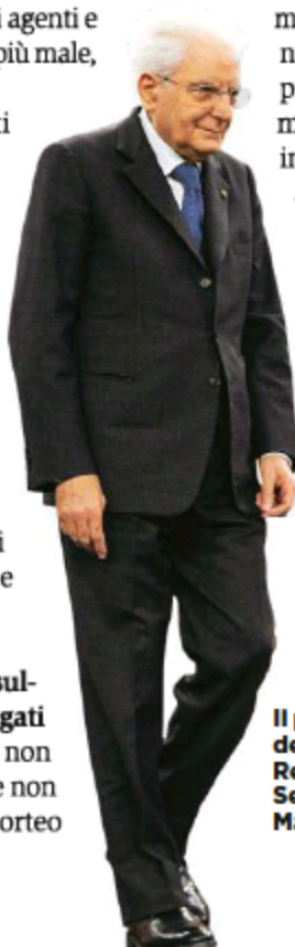
Il presidente della Repubblica Sergio Mattarella.

Il 23 febbraio, a Catania, davanti a 200 facinorosi che stanno assaltando un fast food McDonald's, la catena colpevole di distribuire pasti gratis ai soldati in Israele, un drappello delle forze dell'ordine, senza protezioni, deve abbassare la saracinesca per evitare il peggio. Un agente del X Reparto mobile ne esce con un piede fratturo