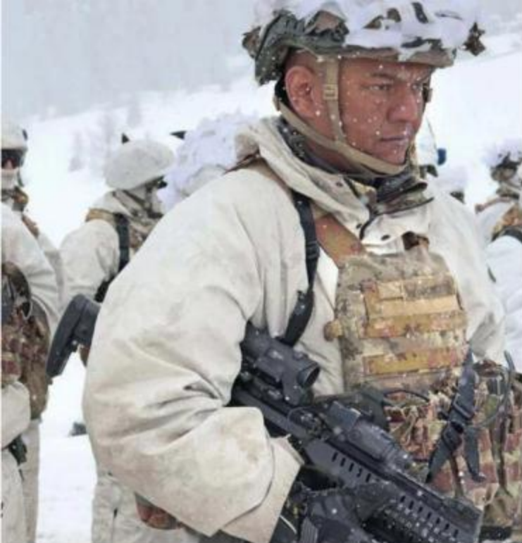
Alpini italiani nell'operazione «Volpe Bianca», che simula la guerra nell'Artico.

si contrappone alla grande base russa del «Trifoglio artico», 14 mila metri quadrati inaugurata da Vladimir Putin nel 2017. Mosca è l'azionista territoriale di maggioranza fra i ghiacci. Guerra bianca è il titolo del libro edito da Neri