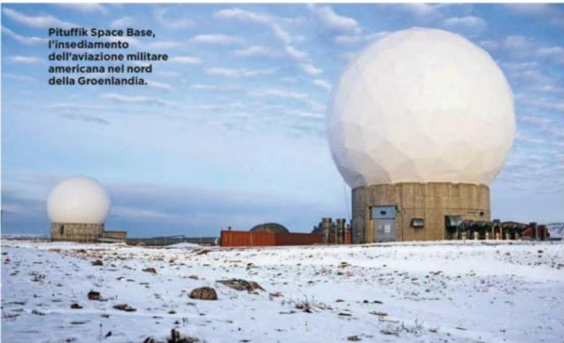
Pituffik Space Base, l'insediamento dell'aviazione militare americana nel nord della Groenlandia.

La corsa alla «nuova frontiera» è un obiettivo strategico delle superpotenze, che puntano anche alla militarizzazione dell'Artico. L'avamposto americano di Thule in Groenlandia, ribattezzata base spaziale di Pituffik,