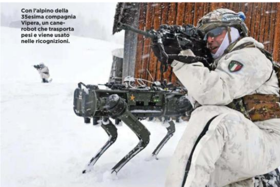
Con l'alpino della 35esima compagnia Vipera, un cane-robot che trasporta pesi e viene usato nelle ricognizioni.

Il progetto è la Via della seta polare da Dalian, città affacciata sul mar Giallo a Rotterdam. Un documento strategico cinese ribadisce «il diritto a navigare, sorvolare, eseguire ricerche scientifiche,