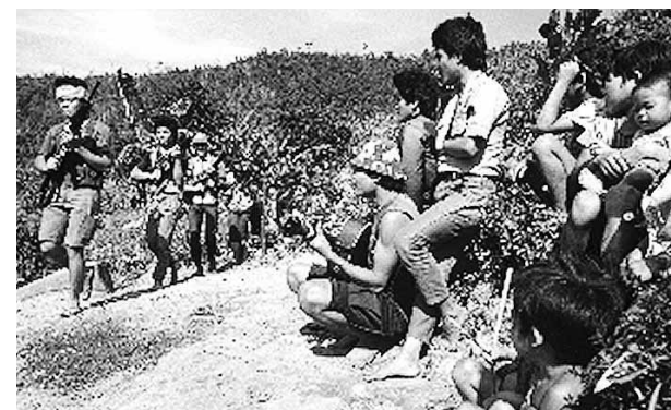
NICARAGUA 1987 C'è anche una giovane donna fra i guerriglieri Contras che si battono contro i sandinisti, qui fotografati prima di un attacco