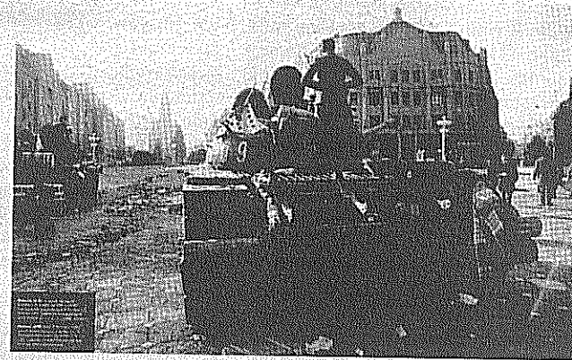
Romania. La piazza di Timisoara durante la rivolta del 1988