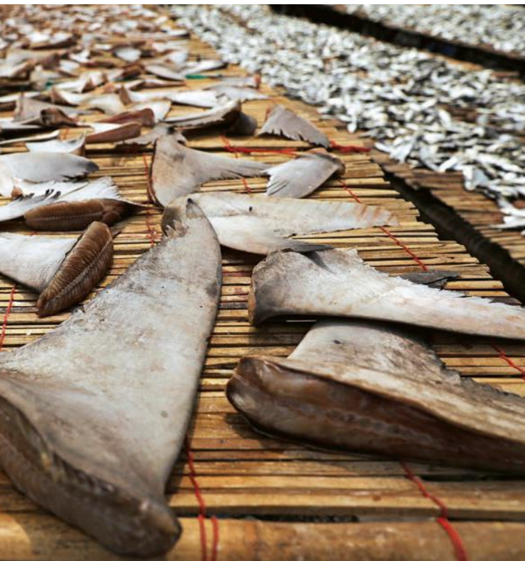
Pinne di squalo in vendita in un mercato. In India, nel 2018, ne sono state sequestrate 8 tonnellate. A sinistra, il generale in congedo Leonardo Tricarico, presidente della Fondazione Icsa, che si occupa di sicurezza, difesa e intelligence.

Decine di migliaia di elefanti sono stati uccisi in Africa da ex combattenti di gruppi guerriglieri o del terrore convertiti al bracconaggio grazie «all'abilità con le armi e la conoscenza operativa della savana» denuncia il rapporto. Anche gruppi jihadisti in Libia sono coinvolti nel traffico illegale di fauna selvatica. Ormai il fenomeno è esploso pure online, soprattutto nel Deep web, la rete parallela utilizzata dalle organizzazioni criminali. I contrabbandieri hanno messo in vendita anche i formichieri, e secondo un'inchiesta dell'International Fund for Animal Welfare sono apparsi più di 5 mila annunci online per un valore di 3 milioni di euro.