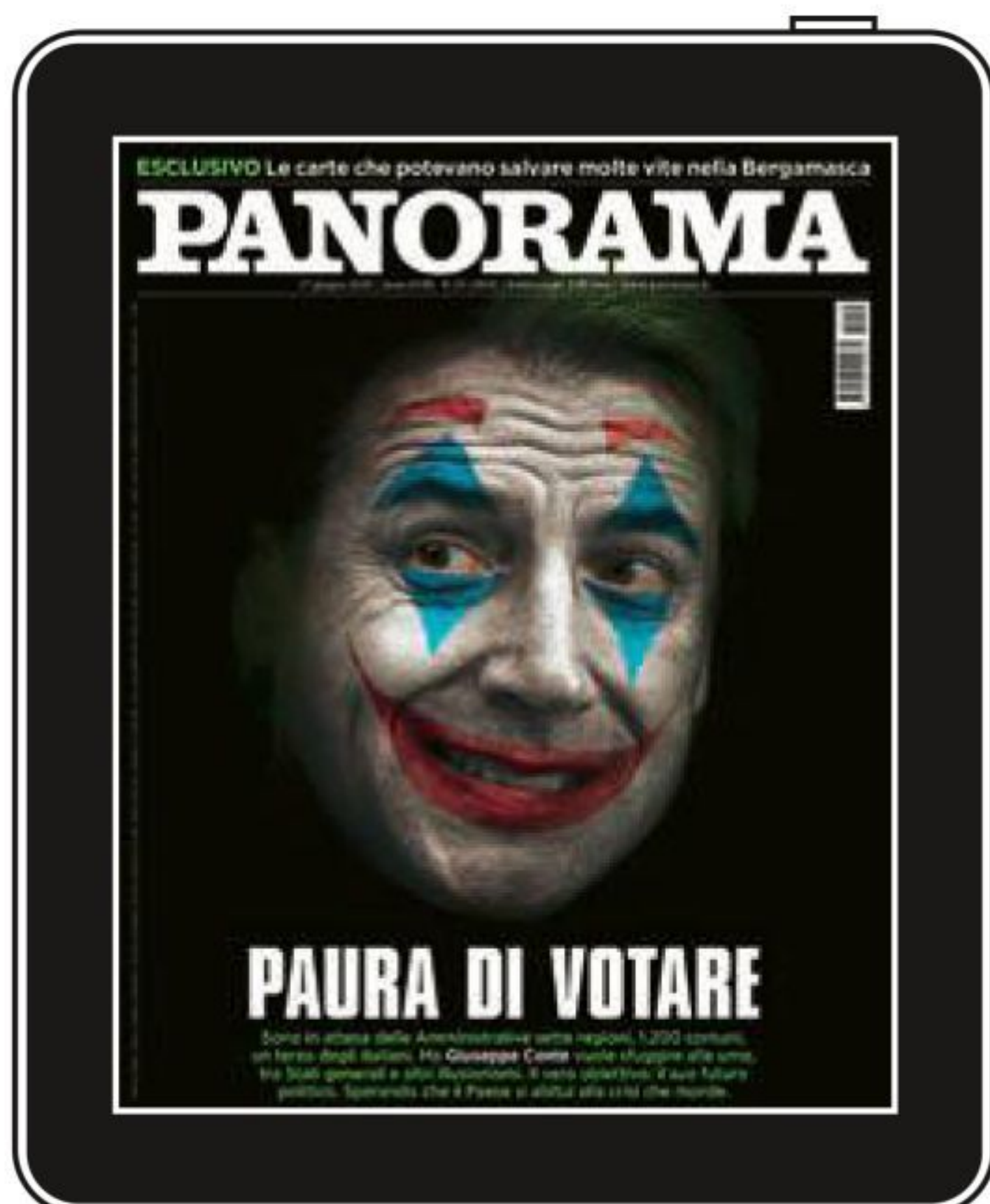
In copertina: foto Riccardo Pareggiani NurPhoto/Getty Images elaborazione di Stefano Carrara