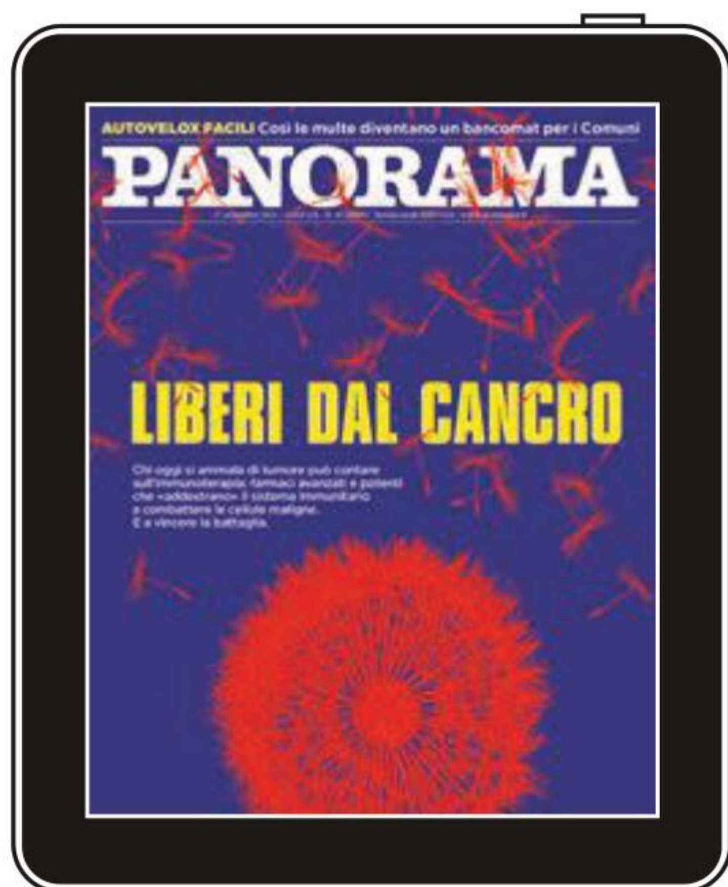
In copertina: foto Getty images elaborazione di Stefano Carrara

Editoriale / Aboliamo il reddito di cittadinanza 6