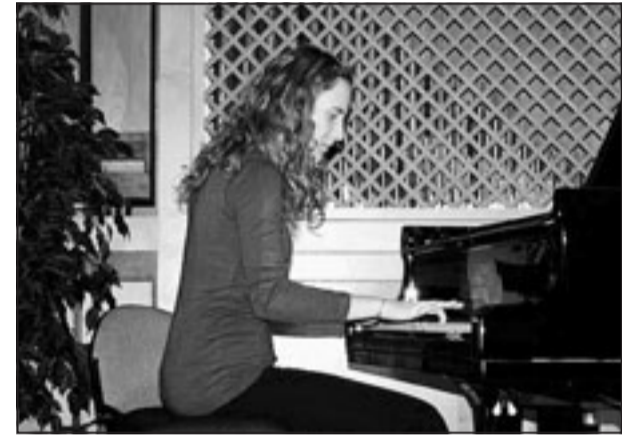
Un'allieva durante l'esecuzione del concerto natalizio

Giovani e talentuosi, accomunati dalla passione per la musica, applauditi in occasione del Concerto di Natale proposto nei giorni scorsi a Trieste e Capodistria: sono gli studenti del Conservatorio Tartini e della Scuola di Musica di Capodistria, giovani musicisti fra i 15 e i 18 anni che hanno rinnovato con successo una formula di scambio fra istituzioni italiane e slovene.